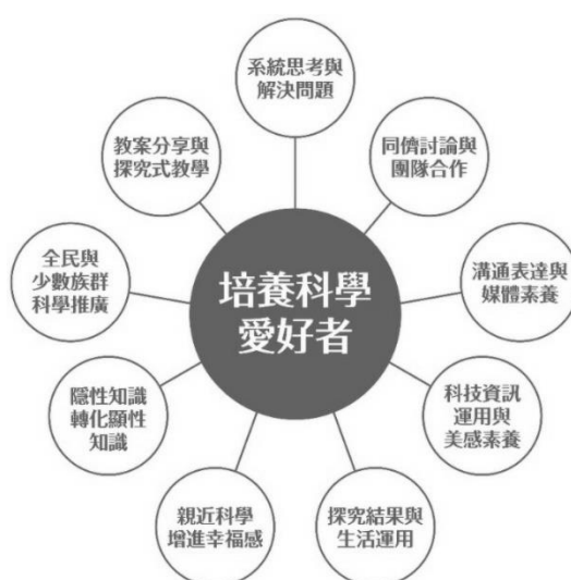
圖 1、全國科學探究競賽核心價值

本競賽的核心目的為「培養科學的愛好者」與親近科學的幸福感，藉由競賽讓同儕間進行討論與團隊合作，從討論間系統思考與解決問題，將隱性知識轉化成顯性知識，系統化的將研究結果記錄在影音及文字中，培養科技資訊運用與媒體溝通表達的素養，最終能夠將探究結果運用在生活周遭中。對於女性、新二代及原住民的作品都有適當加分，以鼓勵他們發揮科學探究精神。對於優秀作品本計畫也期待能夠加值其價值，例如出版刊物或親自演示，如此完整構成本競賽的核心價值的圖，如下圖 1 所示。